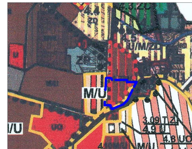
Wyrys ze Studium uwarunkowań i kierunków zagospodarowania przestrzennego gm. Suchy Las

M/U tereny zabudowy mieszkaniowej i usług