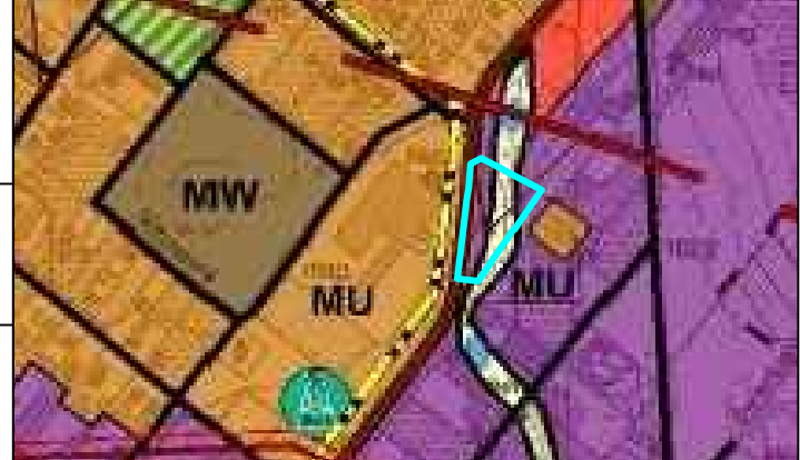
Wyrus ze Studium uwarunkowań i kierunków zagospodarowania przestrzennego gminy Suchy Las

API Sp. z o.o. architektura, planowanie, inwestycje 60-835 Poznań, ul. Mickiewicza 27/8 tel. 61 223 09 08, e-mail: biuro@apiszoo.pl