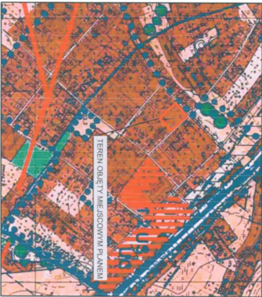
WYRYS ZE STUDIUM GMINY 1:10 000