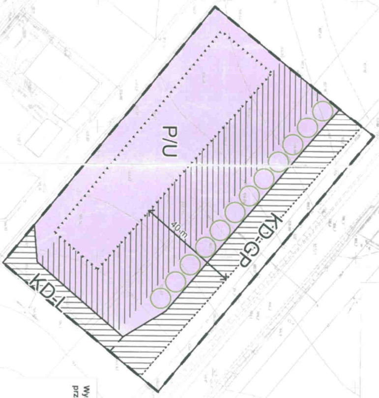
Wzrys ze Studium uwarunkowań i kierunków zagospodarowania przestrzennego gm. Suchy Las